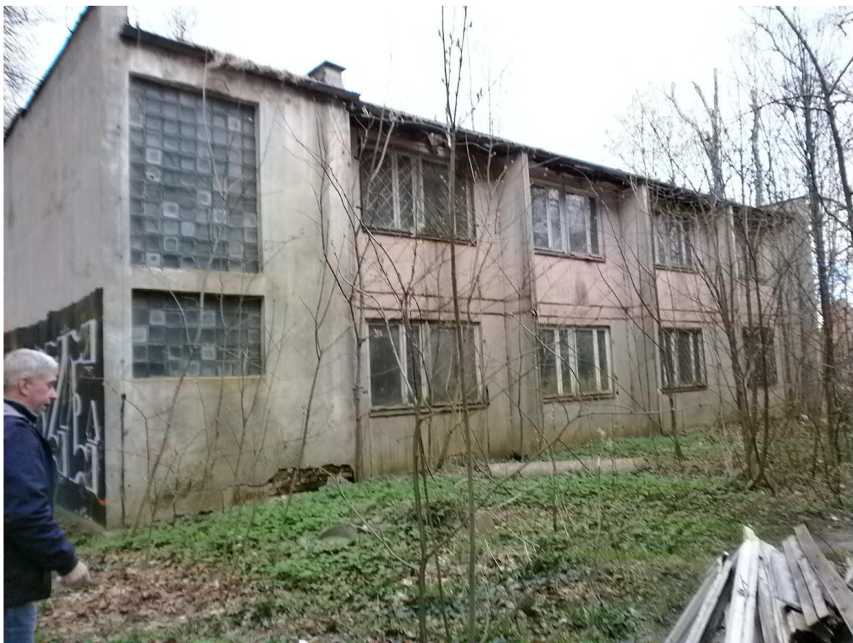
Zdjęcie nr 9 , 10 – Widok na budynek garażowy