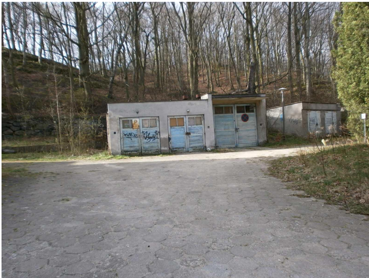
Zdjęcie nr 11 , 12 – Widok na budynek straży przemysłowej