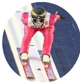
MŚ W NARCIARSTWIE KLASYCZNYM W LAHTI