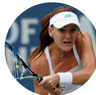
WTA W ST. PETERSBURGU, DOHA, DUBAJU