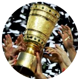
PUCHAR NIEMIEC 1/8 FINAŁÓW