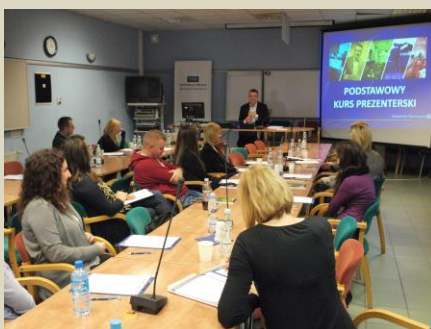
Sala wykładowa (S-5)