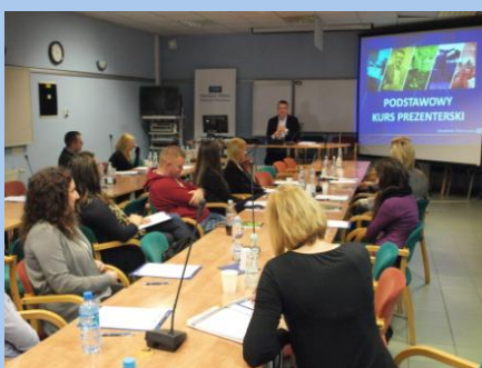
Sala wykładowa (S-5)