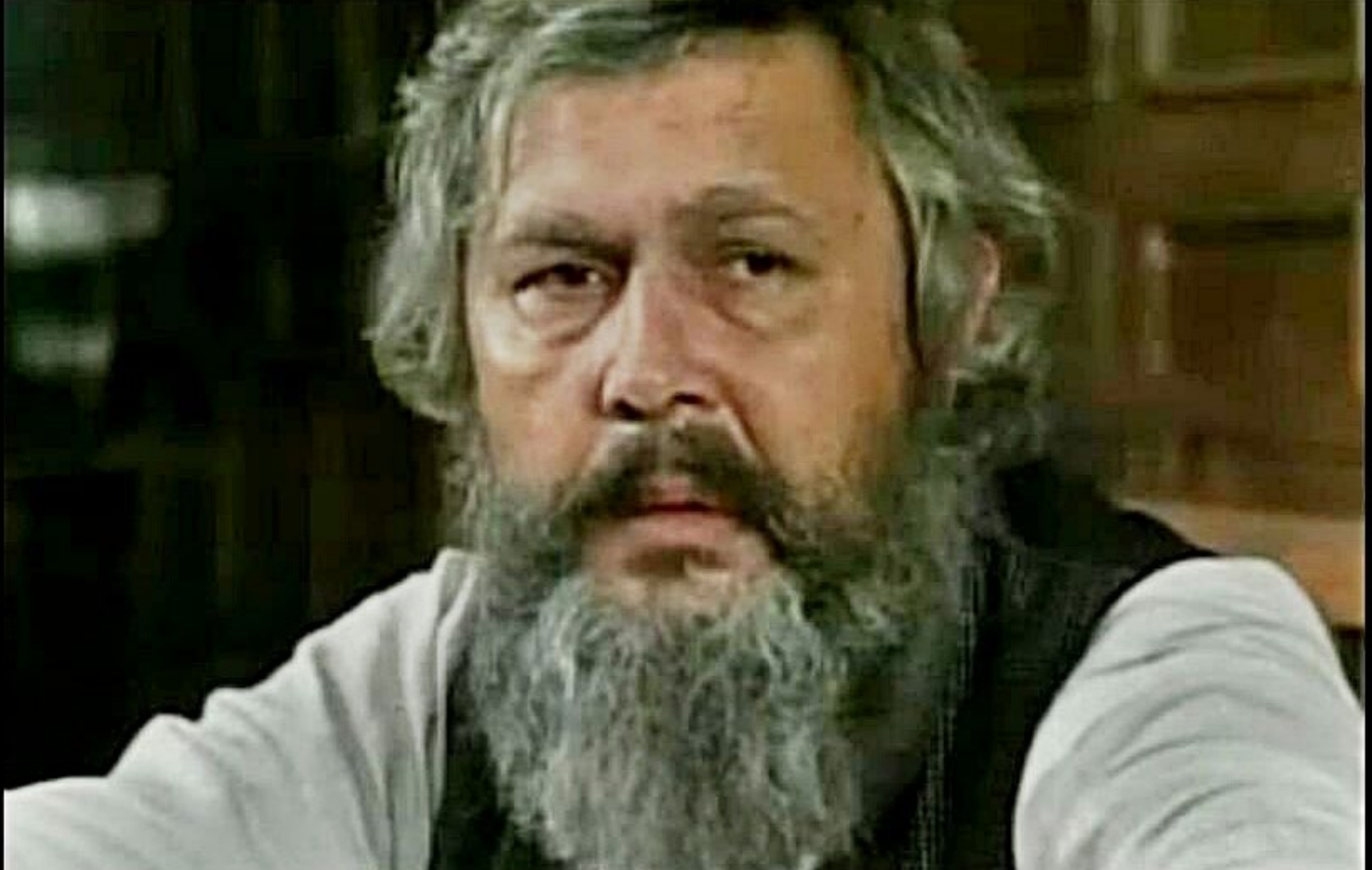
Znachor (wersja po rekonstrukcji)