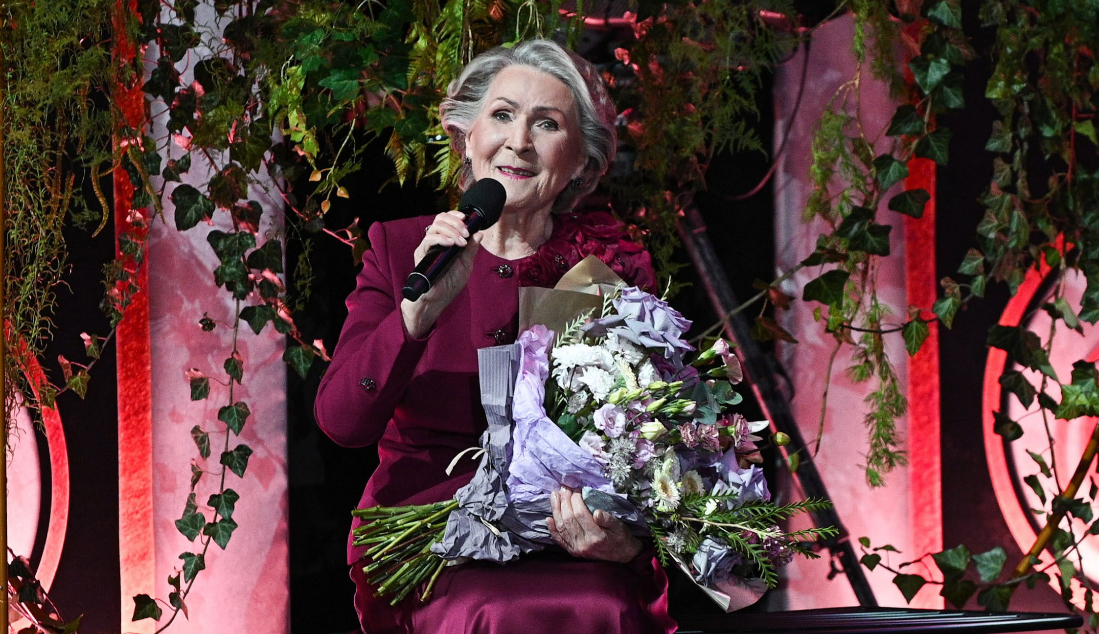
Maleńki znak – świąteczny koncert Ireny Santor