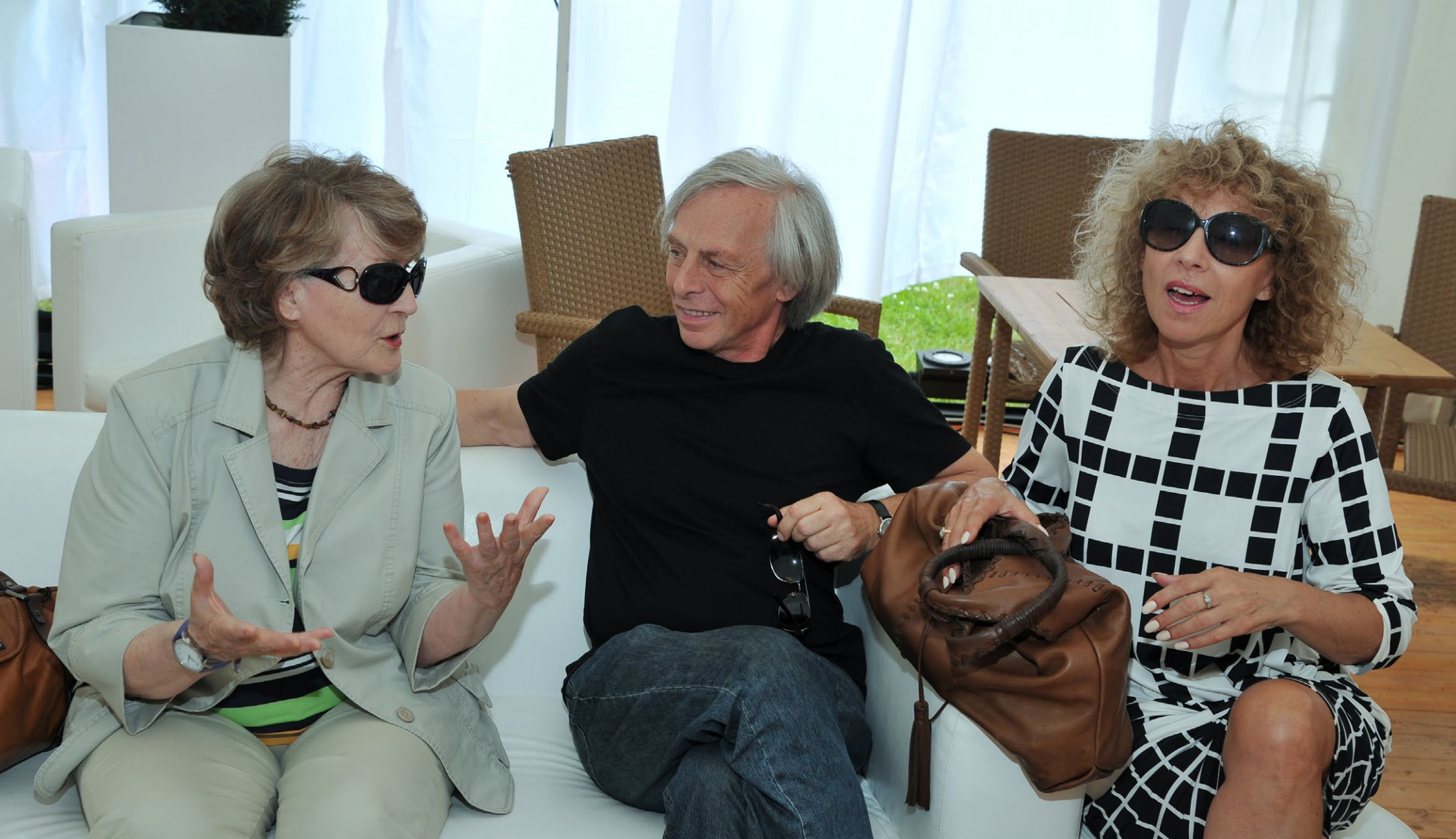
Irena Santor. Magiczny jeden krok