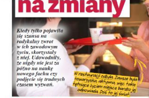
Kiedy tylko pojawiła się szansa na radełku zwrot w ich zawodowym życiu, skorzystały z niej. Udowodniły, że nigdy nie jest za późno na zmianę swojego fachu czy podjęcie się trudnych czasem wyzwań.